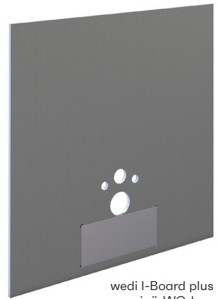
wedi I-Board plus seinä-WC-levy